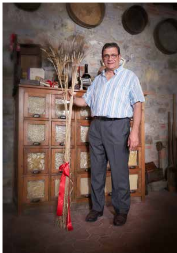
«Produciamo pasta anche con anche grani antichi», spiega Fabbri

Curiosità tra le curiosità, il museo interno, all'interno del pastificio: «Da noi, a Strada in Chianti - chiarisce Fabbri - abbiamo un luogo della memoria dedicato alla pasta, nato dall'amore e alla passione del fondatore, Giovanni Fabbri, il quale, dal 1893 fino alla morte, ha collezionato i macchinari che adoperava in ditta. Vi sono, poi, altri oggetti unici, collegati alla pasta e tramandati nelle generazioni. Così abbiamo creato un ambiente dove raccontiamo le conoscenze acquisite in anni di lavoro ma, soprat-