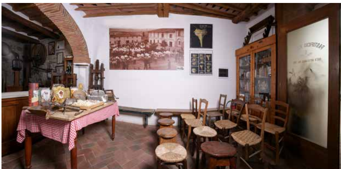
All'interno del museo Fabbri spiega cos'è il glutine e come nasce la sua pasta.

tutto, spieghiamo cosa è il glutine e l'amido e come sono stati modificati i grani di ultima generazione. In sostanza, raccontiamo ai nostri ospiti il percorso che il grano faceva una volta: dalla lavorazione della terra alla sua raccolta col forcone, alla trafilatura e vendita del prodotto finito, la pasta».