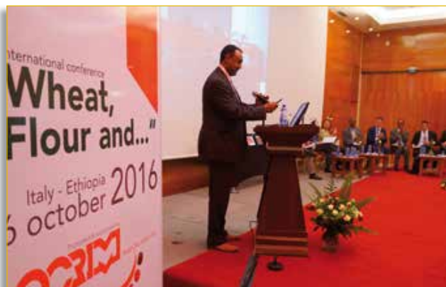
Mebrahtu Meles, viceministro dell'Industria, all'evento organizzato da Avenue media

Il Premio Capitani dell'Anno ha festeggiato quest'anno non soltanto i 21 anni di vita in Italia ma anche il debutto in Etiopia con la prima edizione del riconoscimento dedicata ai rapporti di lavoro ma anche culturali tra l'Italia e il Paese africano. L'iniziativa, nata nel 1995 da un'idea del giornalista ed editore Fabio Raffaelli , vedrà nel 2017 la nascita anche di un'edizione in India .